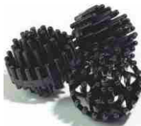
Bio ball media